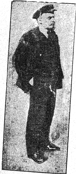
संसार-प्रसिद्ध—मो० लेनिन बोल्शेविज्मके आचार्य !